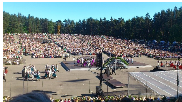
Den största publik HKK har framträtt inför