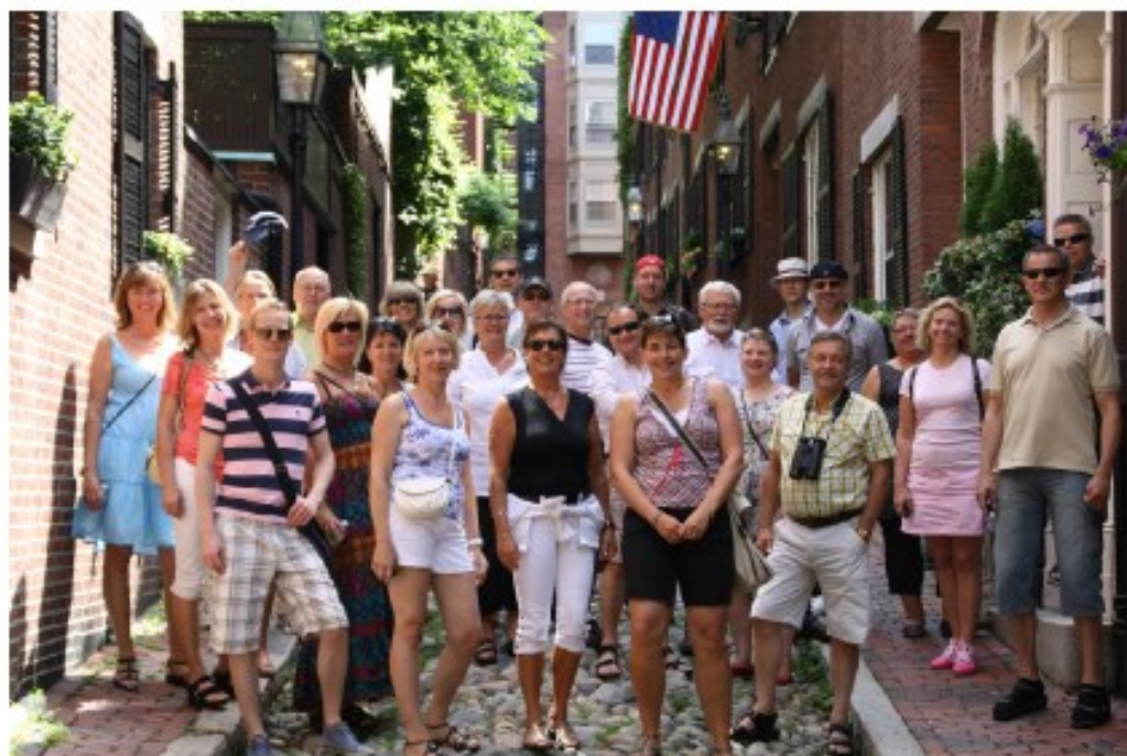
Kören på promenad i Boston.