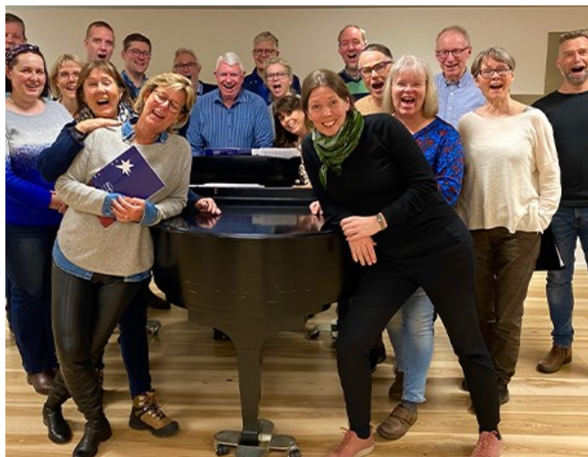
En glad och nöjd kammarkör

Snart var stämningen på topp igen och i mars gjorde HKK inte mindre än tre konserter inom en vecka – ”kvinnoprogrammet” i Kvistofta och Malmö och ett passionsprogram i Kristianstad. Det var mycket noter att hålla i huvudet, men kören hade verkligen längtat efter att få sjunga igen! Konserten i S:t Petri kyrka i Malmö hade skjutits upp flera gånger pga pandemin, så det var välgörande att äntligen få leverera.