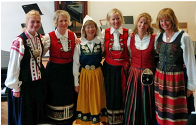
Färggranna HKK-damer under festivalen i Riga

Den masterclass kören höll i under den andra dagen innehöll musik av Sven-David Sandström. Vi deltog förstås i den gemensamma paraden genom staden, då vi träffade körsångare från Sverige och andra länder, där många manifesterade sin hemvist med flaggor och folkdräkter av olika slag. Flera av damerna i HKK hade folkdräkt på sig vid paraden och även vid den stora avslutningskonserten.