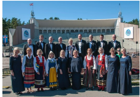
HKK framför utomhusscenen Mežaparks i Riga

Vi var imponerade av hela organisationen för detta jättearrangemang och åkte hem med en samstämd känsla av att ha deltagit i något unikt.