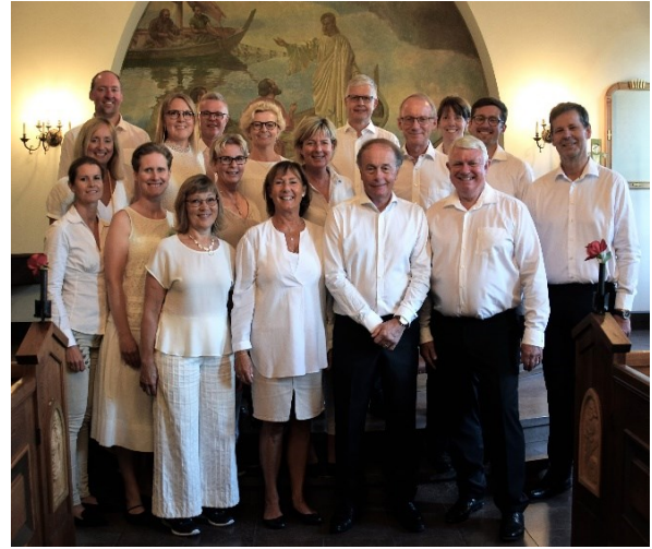
HKK i Mölle kapell våren 2018

till sommaren blev det ett riktigt sommar-program, som bl a framfördes vid en kon-sert i det lilla fina Mölle kapell, dit många besökare letat sig. De följande bilderna togs denna dag.