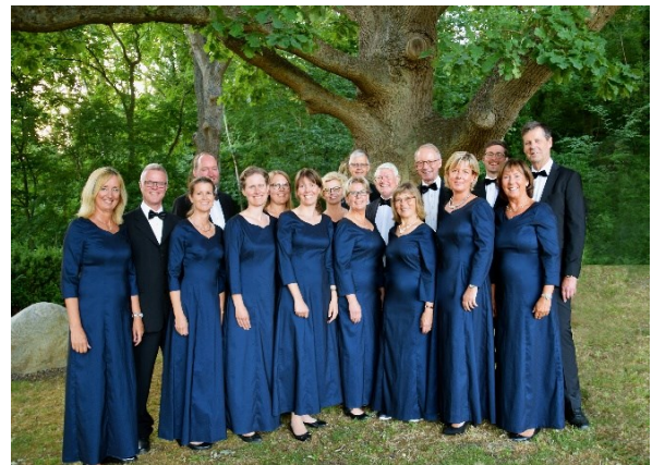
Kören vid den stora eken utanför Mölle kapell

Vi startade höstterminen med ett körinter-nat på Örestrand i Strandbaden. Under hösten blev det konserter i Åstorp och i Båstad, med bl a stycken av Heinrich Schütz, Arvo Pärt, Otto Olsson och J.S. Bach. Därefter sattes fokus på de sedvan-liga julkonserterna – de årliga i Helsing-borg och Strövelstorp samt inledandet av en ny tradition med en dubbelkvartett i Barkåkra kyrka.