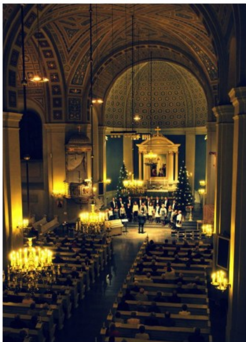
Julkonsert i Sofia Albertina kyrka i Landskrona.