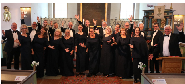
Kammarkören på konsertutflykt till Tåssjö

En vacker försommardag i slutet av maj bekantade vi oss med Tåssjö kyrka, där publiken bjöds på ett vackert sommarprogram. Även kören gladdes åt sol och värme, vilket förhoppningsvis syns i bilden nedan och på detta häftes framsida.