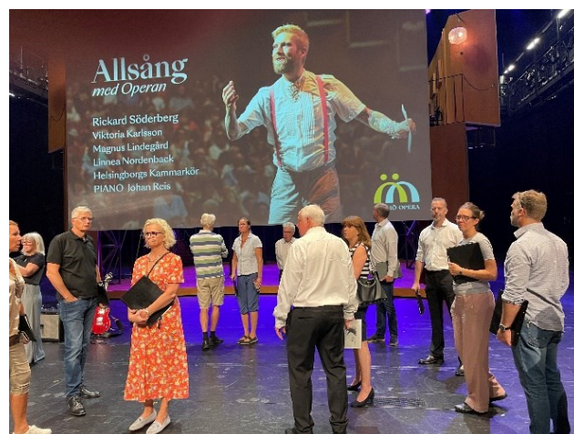
Inte en förvirrad HKK – det var regisserat så här

Vårt engagemang gällde två konserter: först en på Malmö Opera, där vi fick den nästan svindlande upplevelsen att framträda inför en fullsatt salong av ca 1 400 besökare. Dagen efter gavs samma konsert i konsertsalen på Dunkers kulturhus i Helsingborg. Även där var det fullsatt, innebärande ca 300 åhörare. Det blev två jättefina upplevelser med härlig stämning. I nedanstående bild från repetitionen i Malmö, syns körens medlemmar i ett av de inslag där vi agerade som operakör.