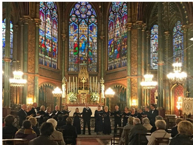
HKK i L'église Saint-Eugène-Sainte-Cécile