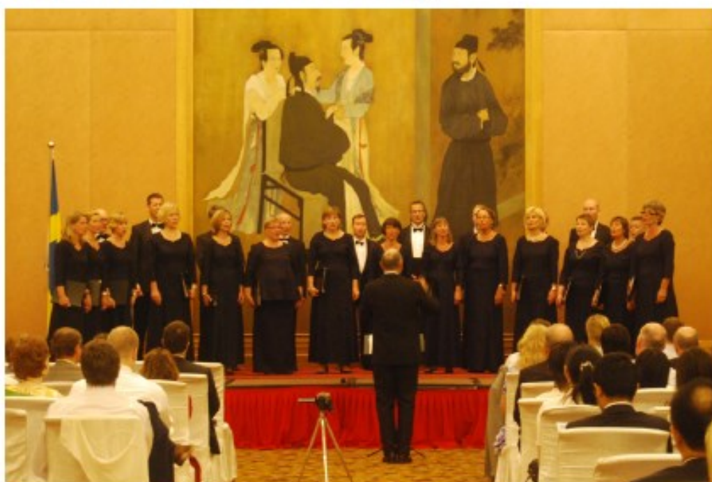
Konsert för Svenska Handelskammaren i Shanghai.