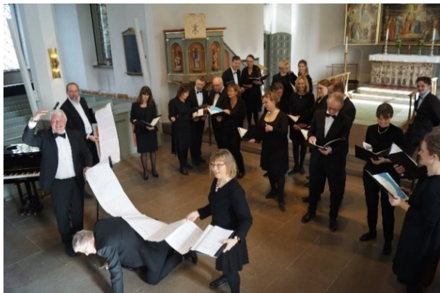
En körsångare måste kunna hantera olika notskrifter

Det äldsta stycket i programmet var komponerat av Hildegard von Bingen, verksam på 1100-talet. Där fanns också verk av fyra olika nutida tonsättare i vår egen ålder. Programmet framfördes bl a i Ängelholms kyrka, där vi passade på att ta några nya, delvis lite spexiga, körfoton.